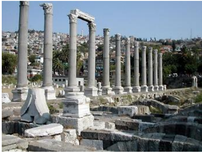
Σμύρνη, Αρχαία Αγορά

Πρόκειται για μία από τις αρχαιότερες πόλεις και λιμένες της Μεσογείου, της αρχαίας Ιωνίας. Ιδρύθηκε περί το 3000 π.Χ. και επέζησε μέχρι σήμερα. Στη μακραίωνη ιστορία της έχει αλλάξει δύο θέσεις. Η πρώτη των προϊστορικών χρόνων που αναφέρει ο Στράβων ως "Παλαιά Σμύρνη" και η δεύτερη που έκτισε ο Μέγας Αλέξανδρος και οι επίγονοι αυτού κατά την ελληνιστική περίοδο. Κατοικήθηκε από ελληνικούς πληθυσμούς από την αρχαιότητα μέχρι και την Καταστροφή της Σμύρνης το 1922 και την ανταλλαγή πληθυσμών που ακολούθησε με τη Συνθήκη της Λωζάνης.